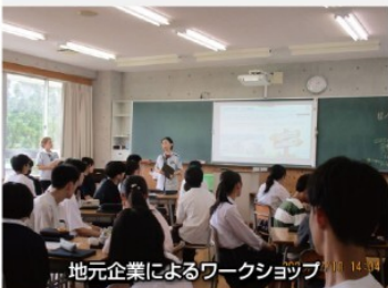
地元企業によるワークショップ