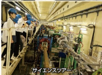
サイエンスツアー