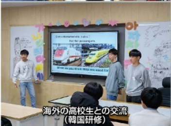
海外の高校生との交流 (韓国研修)