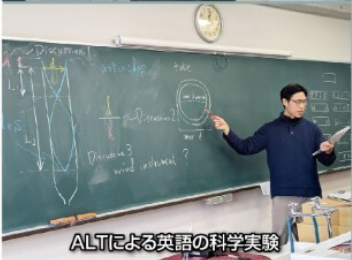
ALTによる英語の科学実験