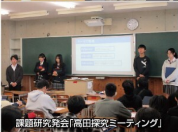
課題研究発表「高田探究ミーティング」