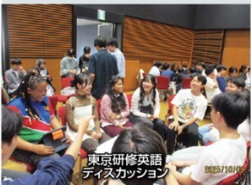
東京研修英語 ディスカッション