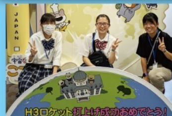
H3ロケット打上が成功おめでとう!

理数科に入って以来、私の世界は何度も再定義を繰り返している。それは理数科で様々なものに出会い、見聞きしてきたからだ。私が高田高校に入学して初めて出会ったのは三年間を共にするクラスメイト達だった。彼らは緊張と不安一杯だった私に気さくに話しかけてくれる優しく私にはないものを沢山持っていた。だからこそ、私達は友人達との関わり合いの中で影響し、影響され合うことができた。特に理数科には多くの人が熱くなる理数科の「共通言語」だ。日々の生活に物理法則を見出した、数学の難問に没頭したりする日常はとても楽しい。また、日々の授業だけでなく先端実験科学講座や課題研究といったSSHの活動もこの上ない刺激になる。自分の知的好奇心が満たされ、湧き出してくるような最高の体験だった。高田高校理数科は私達が世界を広げ、価値観を塗り替えていける場所だ。そんな理数科で皆さんも新しい世界を見てみませんか？